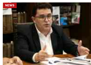
Tema sicurezza in città, il Pd incontra il prefetto: