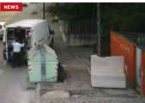
Montesilvano, le fototrappole per i rifiuti fanno bingò: scovati i...