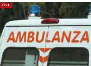
Incidente nel pescarese: auto si ribalta e bimbo