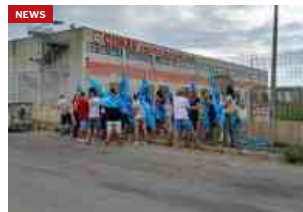
Simply/Auchan, i sindacati annunciano: ancora nessuna novità positiva. E intanto...