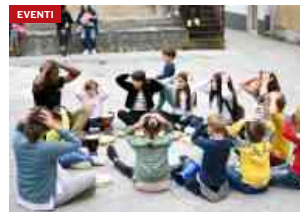
Il progetto “Creatività e Integrazione” si arricchisce di nuovi laboratori...